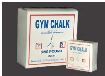
Magnesium Carbonate MAGNESIE